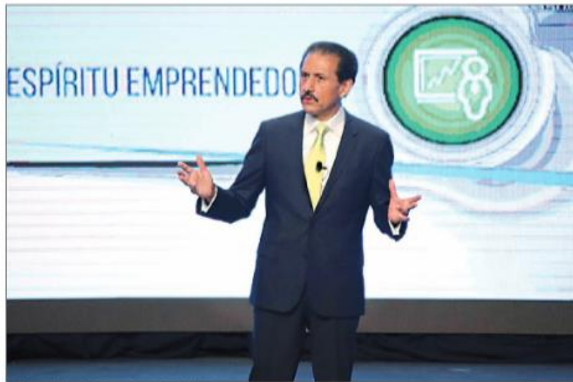
El dirigente de la máxima casa de estudios del estado

Moreno Valle es dueño hasta de ex priistas, afirma Doger, tras la desertión de Jesús Morales