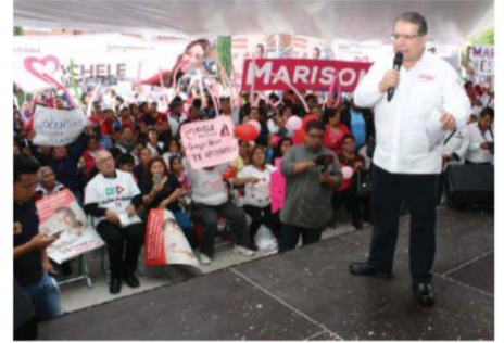
Martha Erika Alonso Hidalgo cerró en el Centro Expositor ante militantes y maestros de las secciones 23 y 51 del SNTE. Luis Miguel Barbosa Huerta finalizó con eventos en los municipios de San Pedro Cholula y Cuautlaningo. El priista Enrique Doger Guerrero concluyó al sur de la capital, con un mitin en la Unidad Habitacional de Agua Santa. Págs. 3A, 4A y 7A