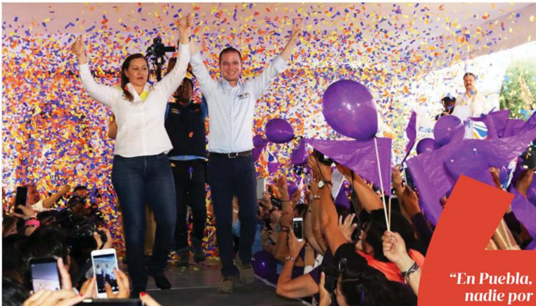
La candidata de Por Puebla al Frente, Martha Erika Alonso, visitó Tecamachalco acompañada del aspirante presidencial, Ricardo Anaya.