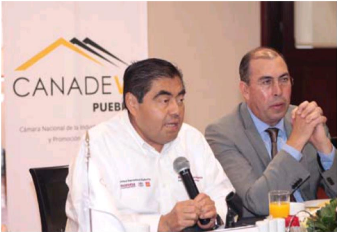
El aspirante de la coalición "Juntos Haremos Historia" se reunió con los desarrolladores de la vivienda.