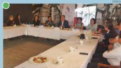
"AÚN QUEDA MUCHO POR HACER PARA EL ENCADENAMIENTO DE LA PRODUCCIÓN CON UNA EXPERIENCIA DE GASTRONOMÍA".

EL ASALTO A LA RAZÓN Carlos Marín cmarin@milenio.com