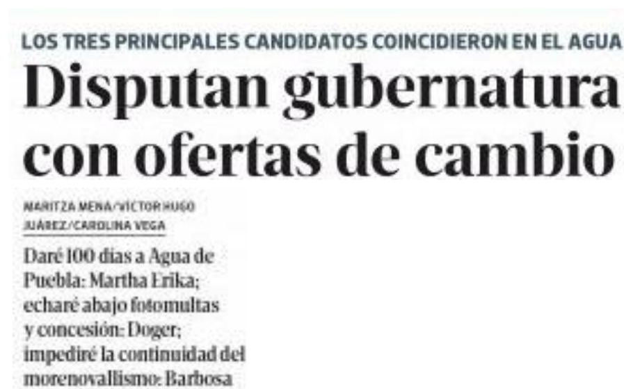
Figura 5 Primer contenido El Sol de Puebla

Para realizar este análisis, se seleccionaron notas sobre Martha Érika Alonso que trataran sobre el mismo hecho y de esta forma para conocer los diferentes tratamientos que muestran los diarios. Pero antes como un primer ejercicio se compararon los primeros contenidos acerca de la elección en cada uno de los periódicos. Se tratan de las primeras notas, o titulares, o portadas que hablan sobre el inicio de las campañas.