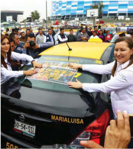
Los taxistas organizaron un evento en el Estadio Cuauhtémoc./ Erik Guzmán