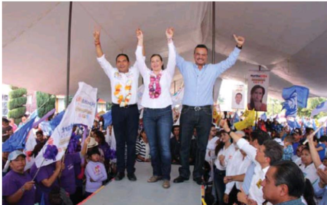
Durante el acto proselitista, los candidatos plantearon sus propuestas. Especial