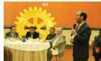
REUNIÓN CON ROTARIOS

Esta elección no se encierra en el acuerdo que el INE aprobó para el primer debate presidencial, pero coincide con el formato que tiene el Instituto Electoral del Estado (IEE) para el debate entre los candidatos al gobierno del estado. Pág. 5A