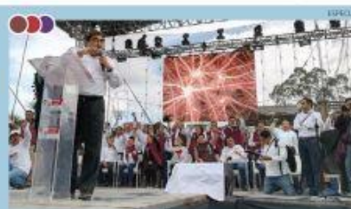
"ESTE PROCESO DE ELECCIÓN SIGNIFICA UN CAMBIO O DEJAR LAS COSAS COMO ESTÁN. HAGAMOS VALER EL PODER"