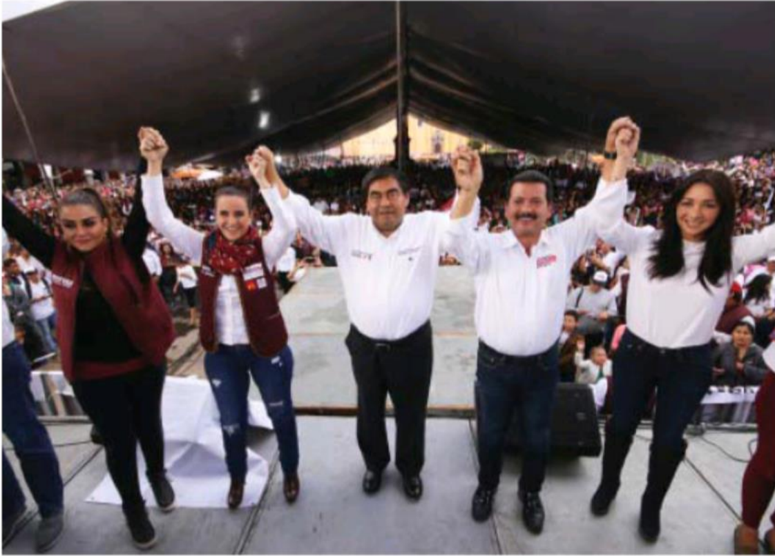
Cierre de campaña de Juntos Haremos Historia en San Pedro Cholula.