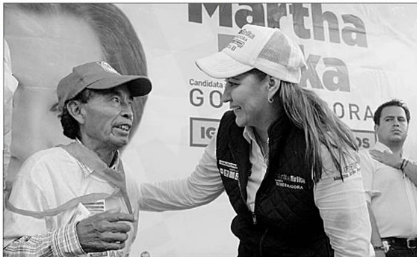
El acto se realizó ayer en una sala del Centro Expositor y de Convenciones, pero no fue organizado por el equipo de la postulante albi azul, sino por el partido magisterial

Tras agradecer la confianza, solidaridad y el respaldo de Nueva Alianza, la abanderada de la coalición Por Puebla al Frente, se comprometió a dar cumplimiento a cada uno de los 13 compromisos que firmó con la dirigencia nacional, por lo que refrendó que no les fallará a los maestros ni a los poblanos.