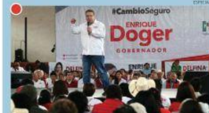
"ESTOY CONVENCIDO DE QUE EL SISTEMA POLÍTICO MEXICANO TIENE QUE DAR MAYOR APERTURA A LOS CANDIDATOS"