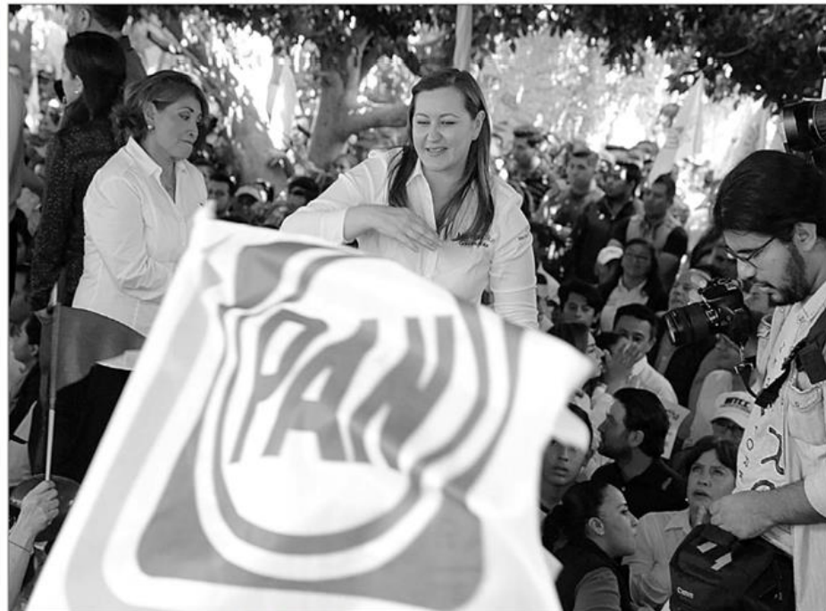
La candidata en el inicio de su campaña