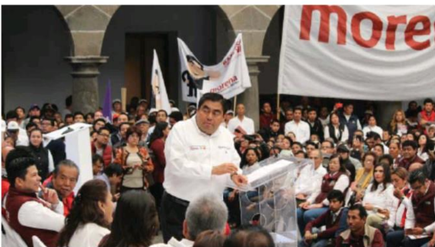
Luis Miguel Barbosa realizó su primer acto electoral en San Pedro Museo de Arte. Pág. 6A