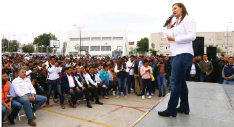
Martha Erika Alonso comenzó su campaña en Tecamachalco, su ciudad natal. Pág. 3A