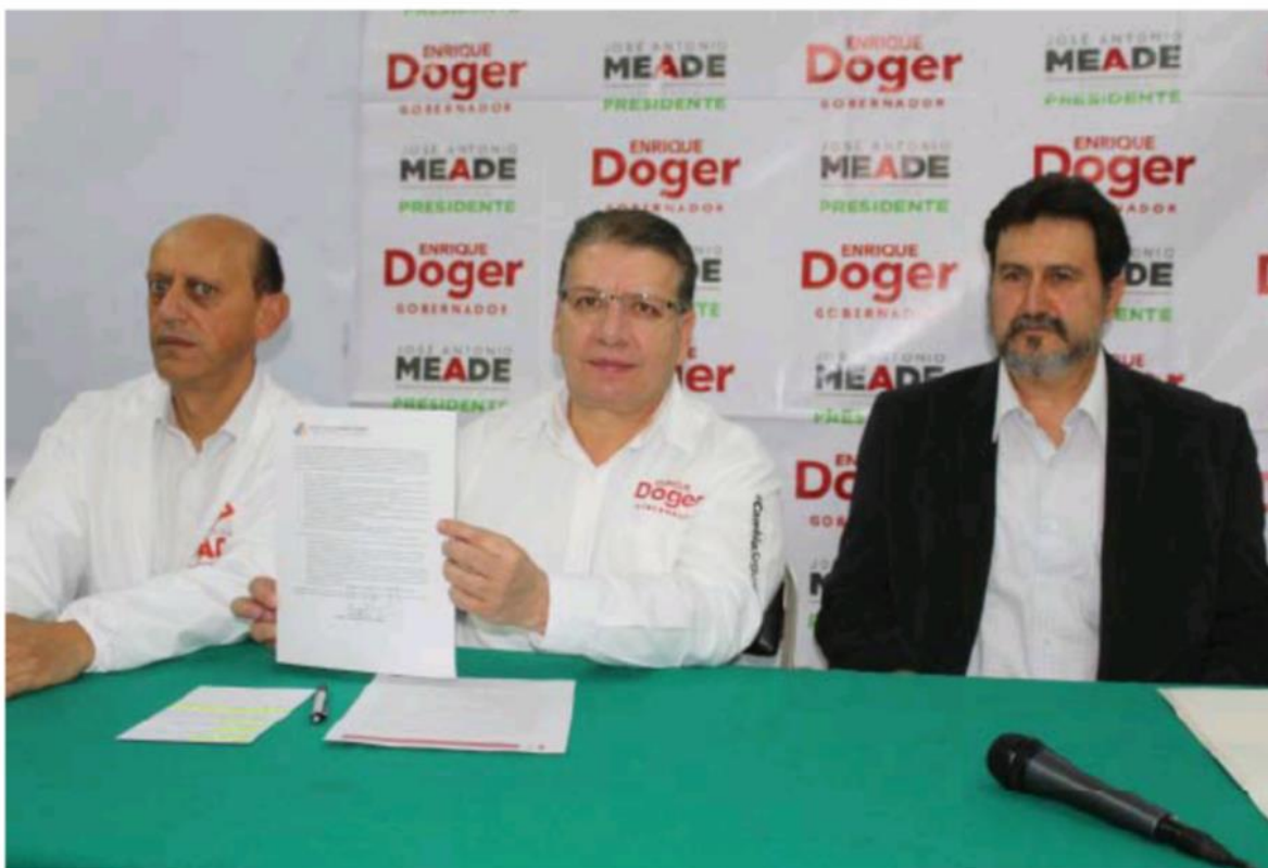
El candidato priista firmó un convenio con organizaciones civiles a favor de la primera infancia. / Javier Pérez