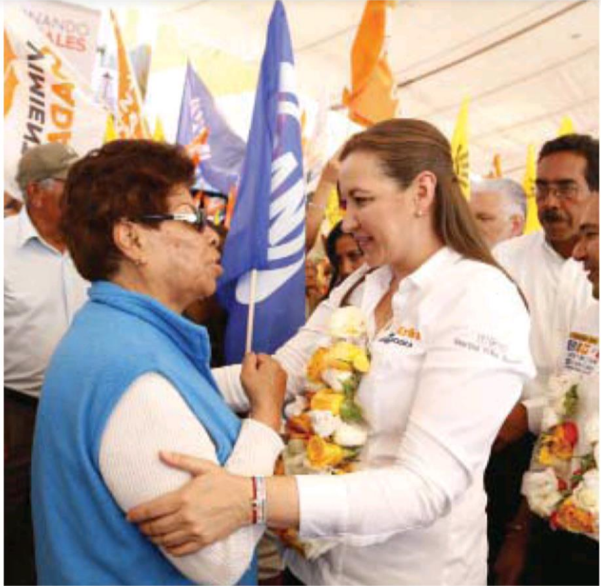
Martha Erika Alonso visitó los municipios de Nopalucan y Rafael Lara Grajales.