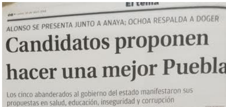
Figura 6 Primer contenido Milenio Diario