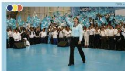
"SOY UNA MUJER DE PALABRA, COMPROMETIDA CON LOS POBLANOS". REITERÓ AL RECIBIR RESPALDO DE NUEVA ALIANZA