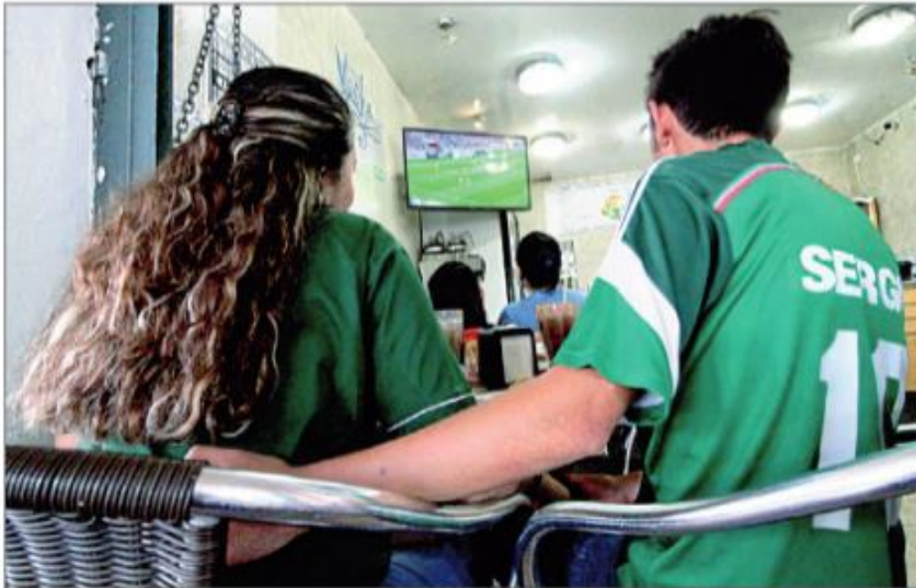
Misionados siguiendo el partido que la selección nacional perdió por 3-0 con su similar de Suecia en el mundial de Rusia

En un evento del Panal y sin el dirigente nacional, Alonso Hidalgo tuvo su último mitin