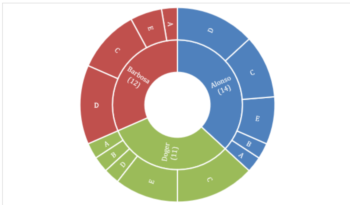
Figura 4 Gráfico de extensión de las notas por candidato

En la gráfica se muestra cómo se distribuyeron las notas de cada candidato por su extensión en un panorama general sumando notas de todos los periódicos y considerando únicamente las notas que tienen como actor principal a los candidatos.