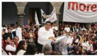
Luis Miguel Barbosa Huerta alzó su primer acto electoral en San Pedro Museo de Arte

Eliminar el programa de fotomultas y terminar con la concesión del servicio de agua potable en la zona metropolitana fueron, por su parte, las primeras propuestas del candidato del PRI Enrique Doger Guerrero, quien anunció campaña acompañado de los candidatos priistas del estado y del dirigente nacional de su partido, Enrique Ochoa Reza. "Vamos a hacer compromisos, no promesas. A garantizarles que se acabará la seguridad, a garantizarles que se acabará la concesión del agua que tanto ha dañado a la gente de Puebla", subrayó. En su turno, el candidato de la coalición fuertes Humberto Hinojosa, Luis Miguel Barbosa Huerta, lanzó la promesa de permitir la comunidad de las políticas morenovallistas, representantes, acusó, por la aspirante Martha Erika Alonso Hinojosa. "Yo creo, yo creo, el morenismo ya cayó, lo cayó, ya cayó, el morenismo ya cayó", comentó, mientras el público le exigía "¡acabar con Gaitán!".