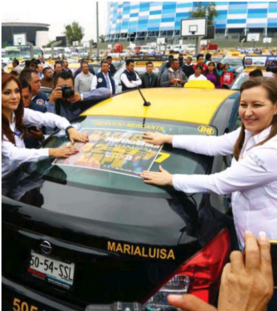
Los taxistas organizaron un evento en el Estadio Cuauhtémoc./ Erik Guzmán