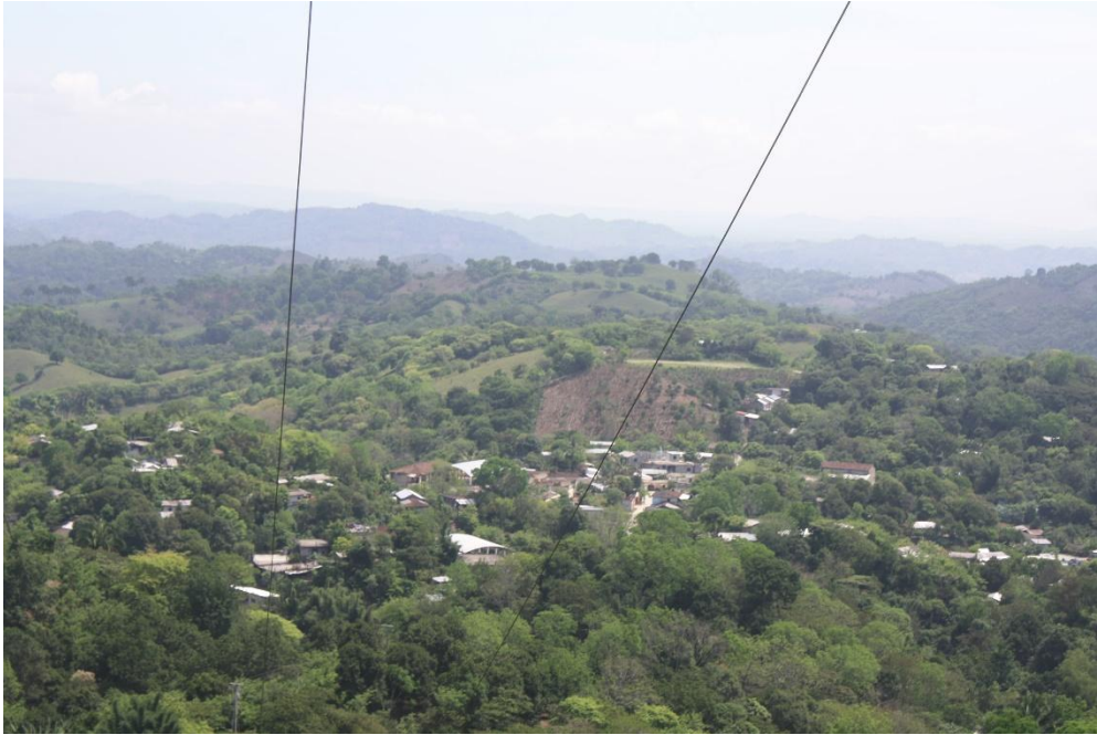
Imagen 2. Ricardo Flores Magón.

La congregación de Ricardo Flores Magón es una comunidad en la cual en los últimos años se ha manifestado un fenómeno migratorio a gran escala por parte del sector masculino y femenino de la población, lo cual incluye jóvenes y hombres padres de familia. Sus objetivos para migrar son personales y se vuelven un reto en común: tener mejores oportunidades de empleos bien remunerados con el fin de brindarles estabilidad económica a sus familias, las cuales dependen en la mayoría de los casos, de la suerte que ellos tengan al salir de casa.