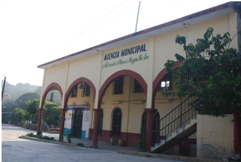
Imagen 1. en Ricardo Flores Magón

Las casas eran de techo de palma, con horcones de coquite, garrochillo, chelawite, pesma, entre otros; cerca de tarro y madera y piso de tierra; se vestían de blanco, camisa de manta, calzón de manta, huaraches de llanta en hombre y en mujeres blusa con encajes, usaban seguilla, aretes y listón para tensarse el cabello y no usaban sandalias, estaban descalzas y usaban faja roja para sujetarse las enaguas; los animales que habitaban eran: leopardos, lobos, armadillos y otros animales como quebrantahuesos. Los animales domésticos que tenían eran: guajolotes, pollos y patos.