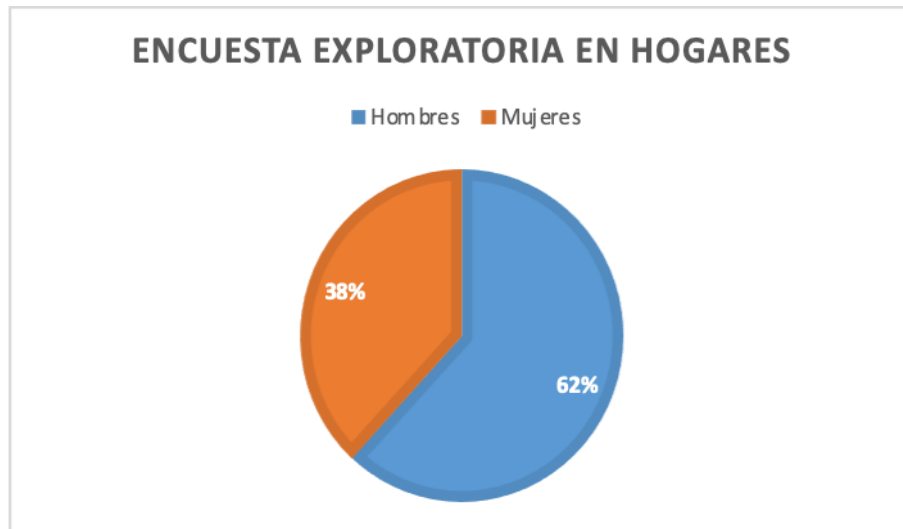
Figura 1. Hombres y mujeres migrantes. Elaboración propia a partir de la Encuesta Exploratoria.

La migración en la congregación empezó a mediados de la década de los 90 después del colapso económico del café en toda la región, lo que afectó a todas las familias. La migración que la mayoría de los padres de Ricardo Flores Magón es temporal, aunque cabe mencionar que algunos se fueron siendo jóvenes y jamás regresaron.