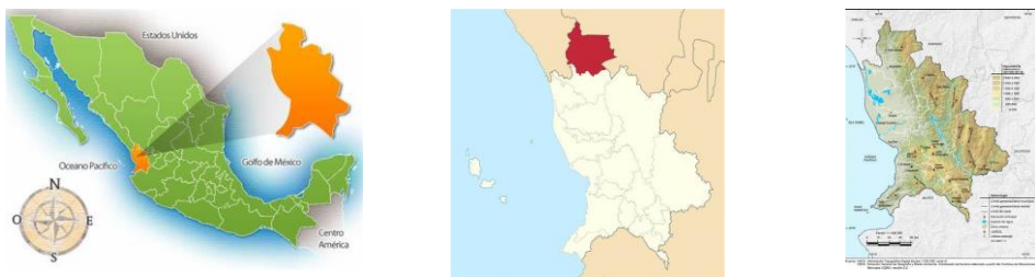
Figura 1. Mapa del Estado de Nayarit. Con señalamiento del Municipio de Huajicori y su orografía

El Municipio de Huajicori, Nayarit se encuentra enclavada en la Sierra Madre Occidental, teniendo un 95% de superficie altamente accidentada y el resto con características semiplanas de acuerdo a la Enciclopedia de los Municipios de México, Nayarit, Huajicori (2009), por lo que sus habitantes viven en la zona serrana existiendo una lejanía con la cabecera municipal y la falta de recursos económicos en sus pobladores repercute en el momento del parto ya que por lo general se atienden con parteras de la comunidad o alguna cercana.