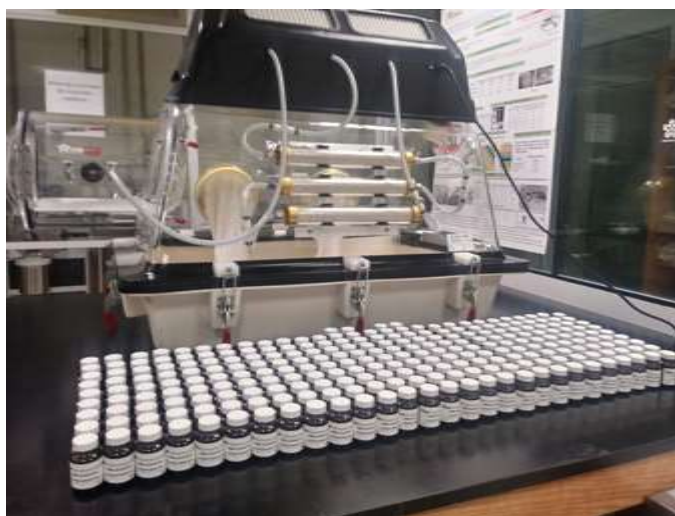
Figura 1. Lote del candidato a material de referencia certificado

Se dejaron unos minutos los frascos expuestos al argón y se cerraron en orden de llenado ascendente. Una vez cerrados los frascos, se libera la presión de argón y se retiraron los frascos para inmediatamente colocar el sello termoplástico (Figura 1)